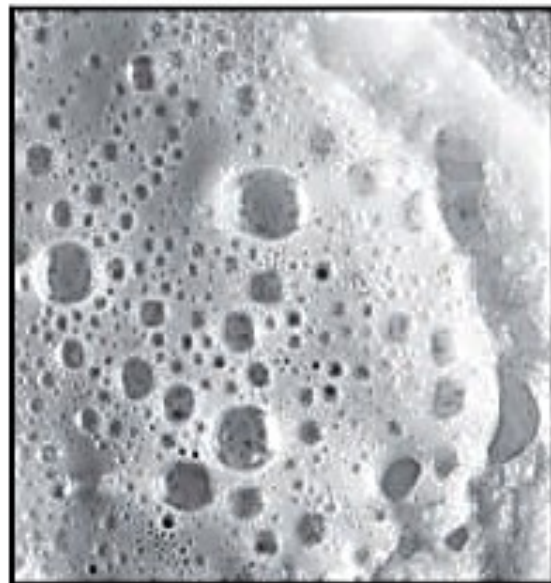
小苏打和白醋混合