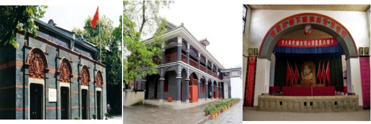
图 1 中共一大会址 图 2 遵义会议会址 图 3 中共七大会场

29. （10 分）请根据下列图片反应的历史信息，并结合所学知识，写一篇 120-140 字的小短文。